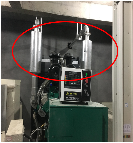
柴油发电机配套的净化设施

项目运营期大气污染物主要为汽车尾气、备用柴油发电机废气。项目地下停车场采用机械抽排风设施加强通风，汽车尾气最终汇集于专用的排风通道，引至楼顶排放。柴油发电机废气经配套的净化设施处理后由专用烟道引至楼顶排放。项目预留有专门的烟道用于排放餐饮业厨房废气，现项目尚未投入使用，无餐饮业入住，后期引入的餐饮业另行相关手续及油烟净化器等相应环保设施。