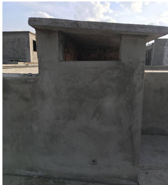
发电机专用排气通道（楼顶）