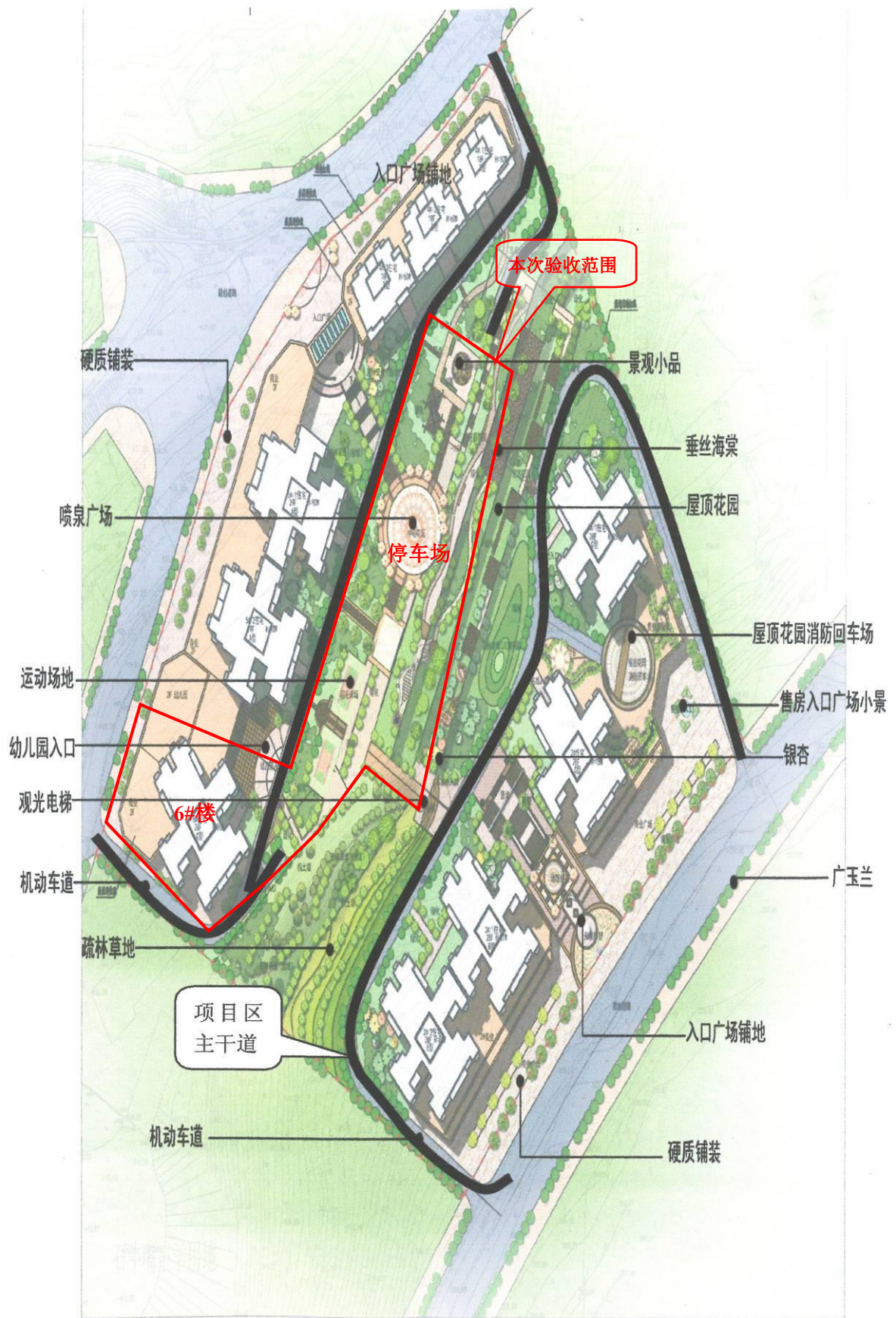
附图 2 项目总平面布置图