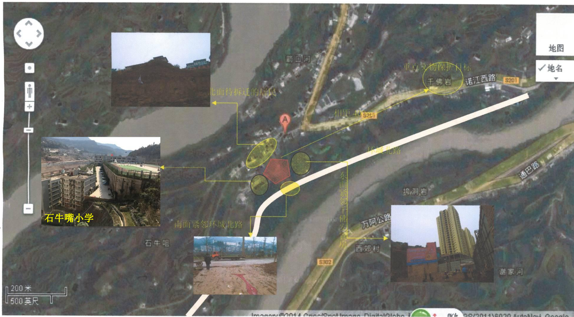
附图3 项目外环境关系图